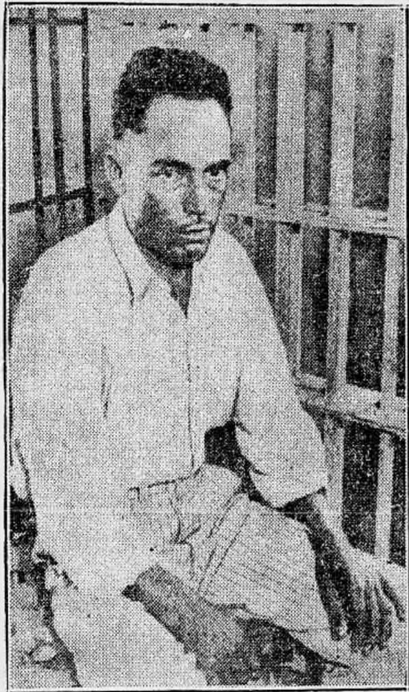
Giuseppe Zingara, que explou na candelra electrica, hontem pela manhã, o crime de morte na pessoa do prefeito de Chicago, e attentado a vida do presidente Roosevelt

Joe Zingara, que alvejou o presidente Roosevelt e matou o prefeito de Chicago, foi hontem electrocutado